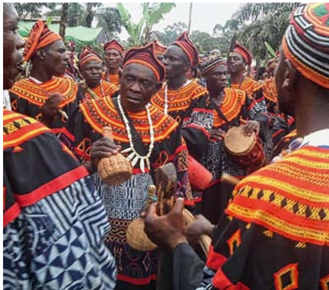
Die Häuptlinge der Bamileke