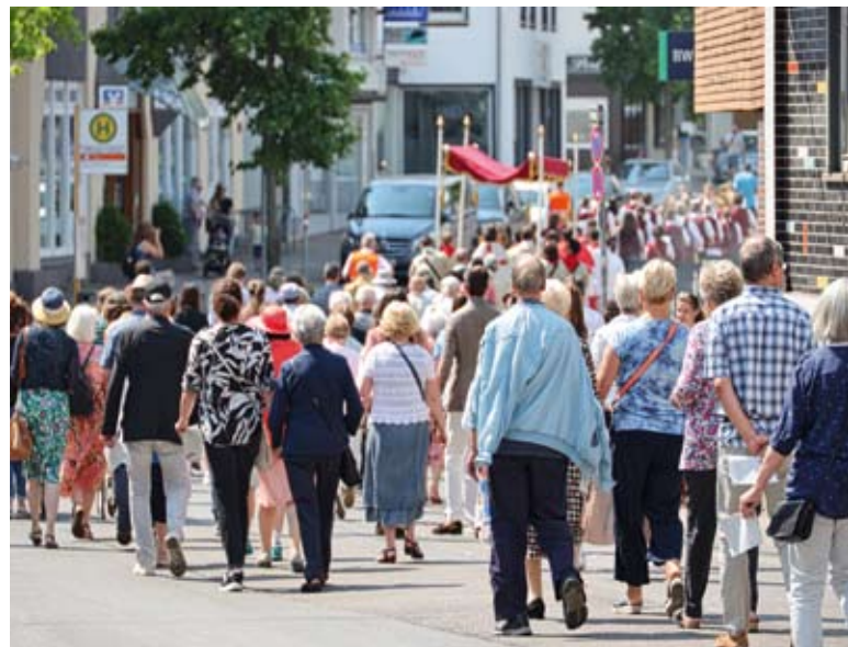
Unterwegs durch den Stadtteil an Fronleichnam